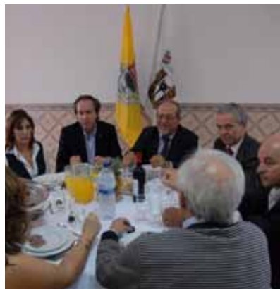
Mesa de Honra