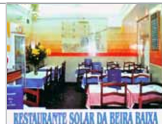
RESTAURANTE SOLAR DA BEIRA BAIXA