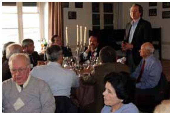
Mesa de honra